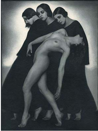
Rudolf Koppitz, Movement Study, 1925.