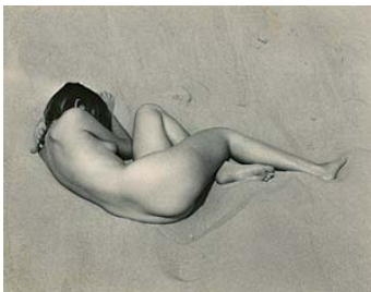
Edward Weston, Nude on Sand, 1936.