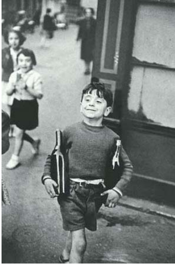
Henri Cartier-Bresson, Rue Mouffetard, 1954.